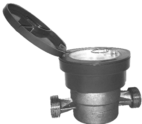
Рисунок 1 – ОСВХ-15 МИД

Схема пломбировки от несанкционированного доступа, обозначение места нанесения знака поверки представлены на рисунке 9.