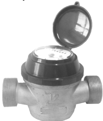
Рисунок 6 – ОСВХ-32