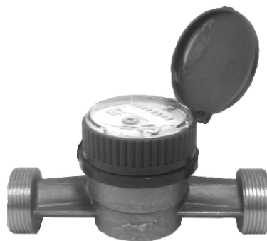
Рисунок 5 – ОСВХ-25