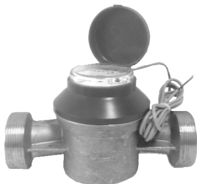
Рисунок 7 – ОСБУ-40 ДГ1