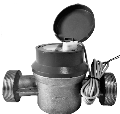
Рисунок 3 – ОСБУ-20 ДГ2