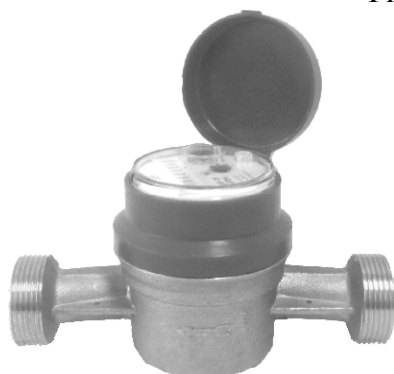
Рисунок 4 – ОСБУ-25