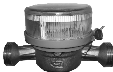
Рисунок 2 – ОСБУ-15