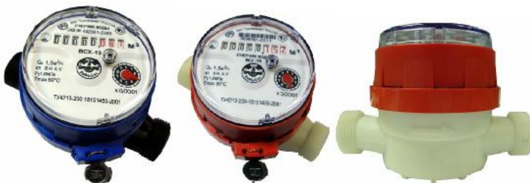
Рис.10 Счетчики холодной и горячей воды ВСХ-15-03; ВСГ-15-03

Счетчики типа ВСХ, ВСХд, ВСГ, ВСГд, ВСТ DN 15 - 03 корпус изготовлен из высокопрочной пластмассы, имеют восьми - разрядный барабанный счетный механизм и один стрелочный индикатор (рис.10).