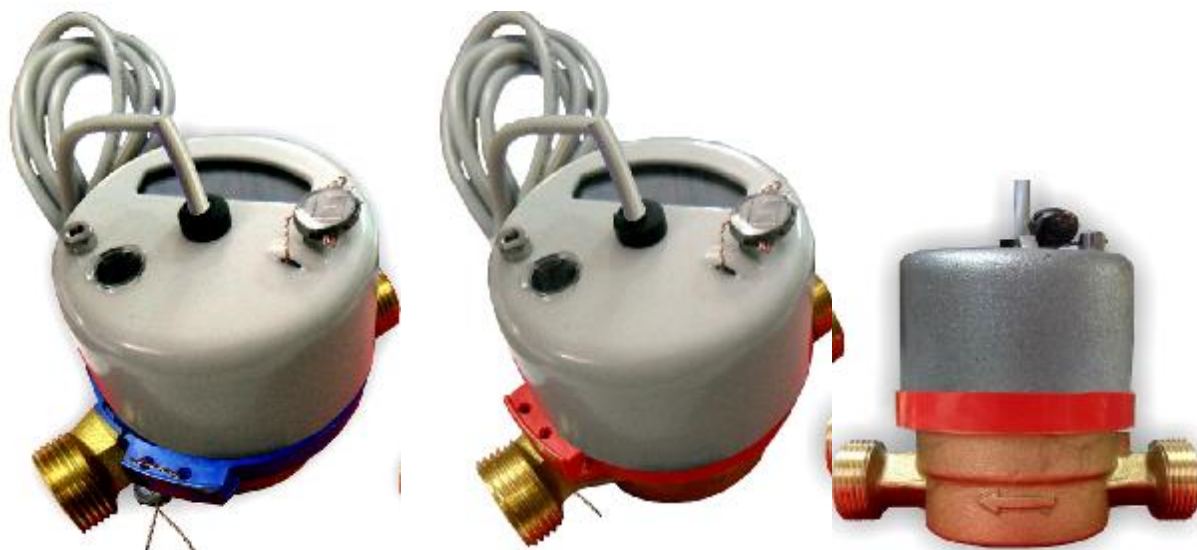
Рис.3 Счетчики холодной и горячей воды с магнитоуправляемым контактом ВСХд-15, ВСГд-15