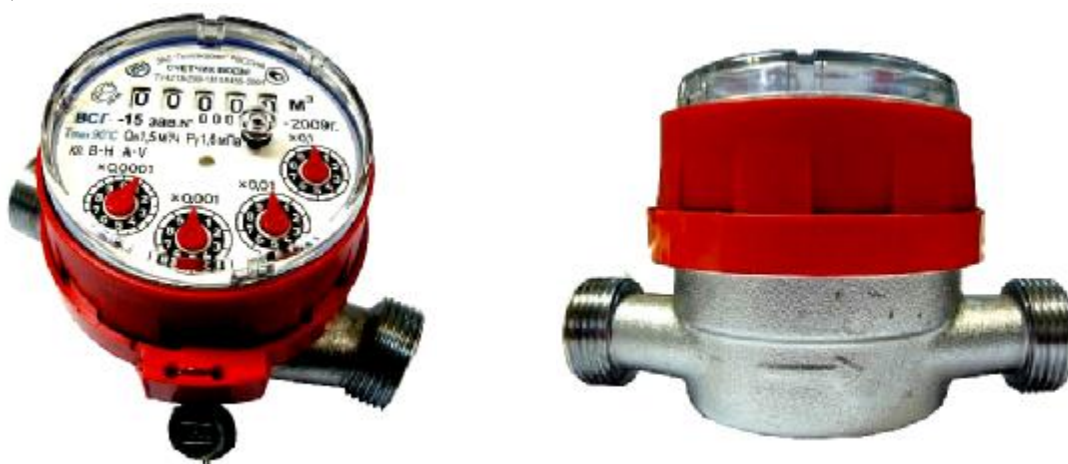
Рис 2. Счетчик горячей воды ВСГ-15

Счетчики типа ВСХ, ВСХд, ВСГ, ВСГд, ВСТ DN 15; 20 – корпус изготовлен из латуни, имеют пяти - разрядный барабанный счетный механизм и четыре стрелочных индикатора (рис.2÷4)