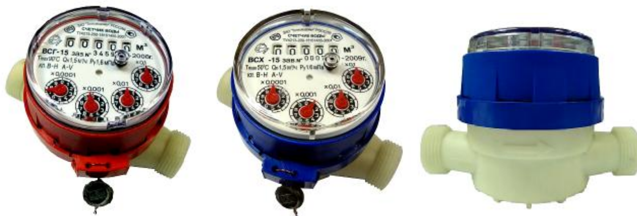
Рис.5 Счетчик горячей и холодной воды ВСГ-15-01, ВСХ-15-01

Счетчики типа ВСХ, ВСХд, ВСГ, ВСГд, ВСТ DN 15; 20 - 01 корпус изготовлен из высокопрочной пластмассы, имеют пяти - разрядный барабанный счетный механизм и четыре стрелочных индикатора (рис.5)