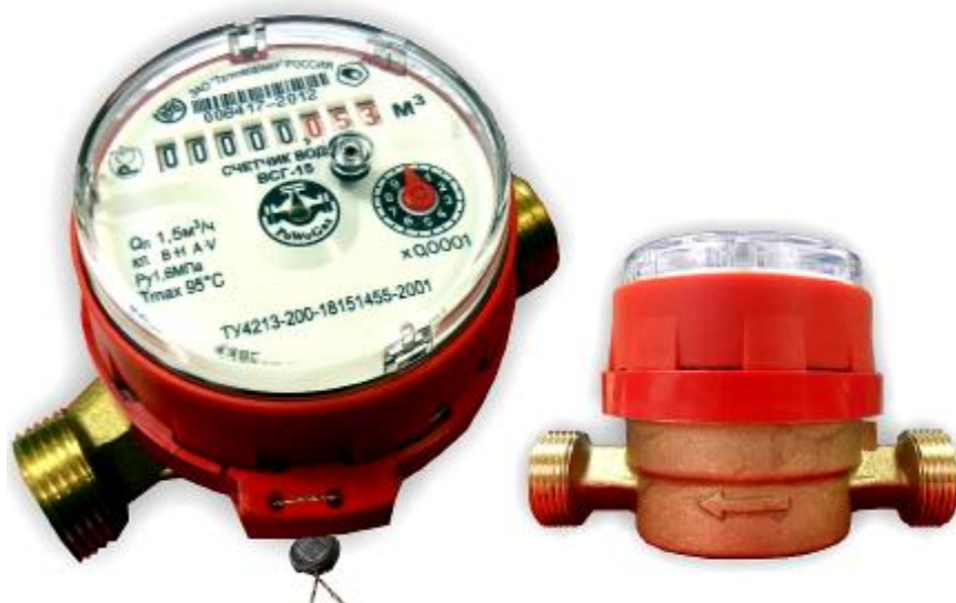
Рис.6 Счетчик горячей воды ВСГ-15-02