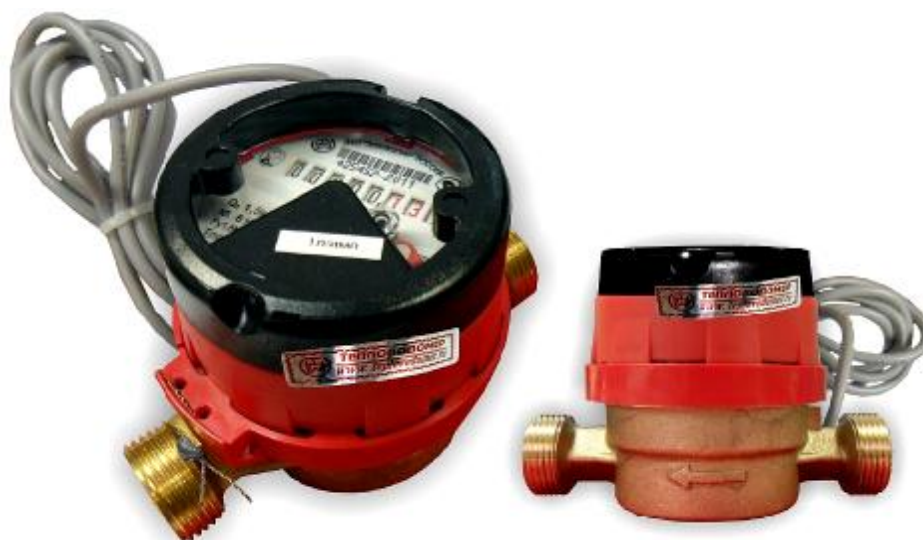
Рис.7 Счетчик горячей воды с магнитоуправляемым контактом ВСГд-15-02