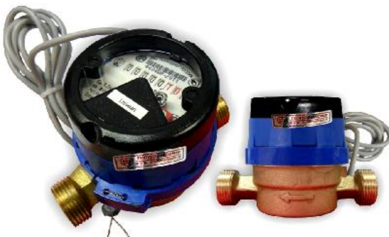
Рис.8 Счетчик холодной воды с магнитоуправляемым контактом ВСХд-15-02