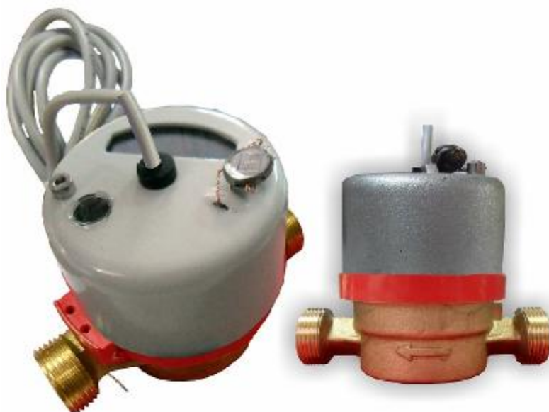
Рис.4 Счетчик горячей воды с магнитоуправляемым контактом ВСТ-15

Счетчики типа ВСХ, ВСХд, ВСГ, ВСГд, ВСТ DN 15; 20 - 01 корпус изготовлен из высокопрочной пластмассы, имеют пяти - разрядный барабанный счетный механизм и четыре стрелочных индикатора (рис.5)